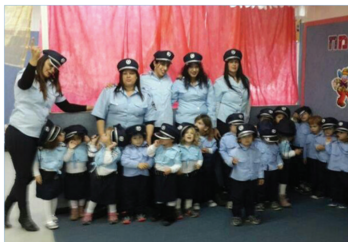
חגיגת פורים בגן