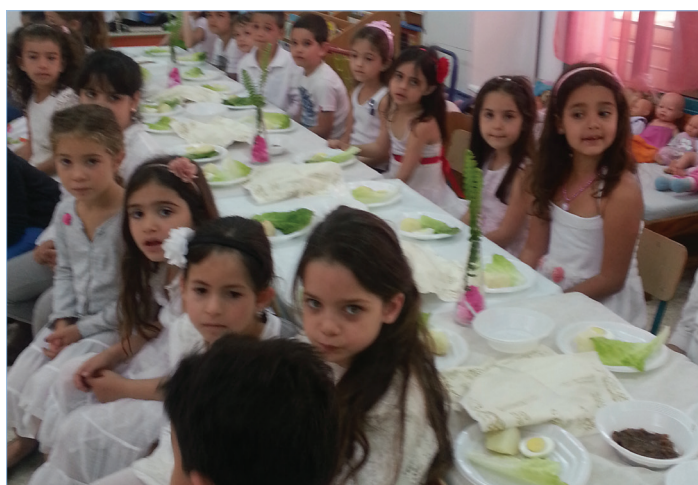
אביב הגיע פסח בא