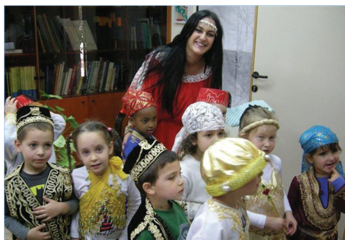
משכנס אדר מרבים בשמחה